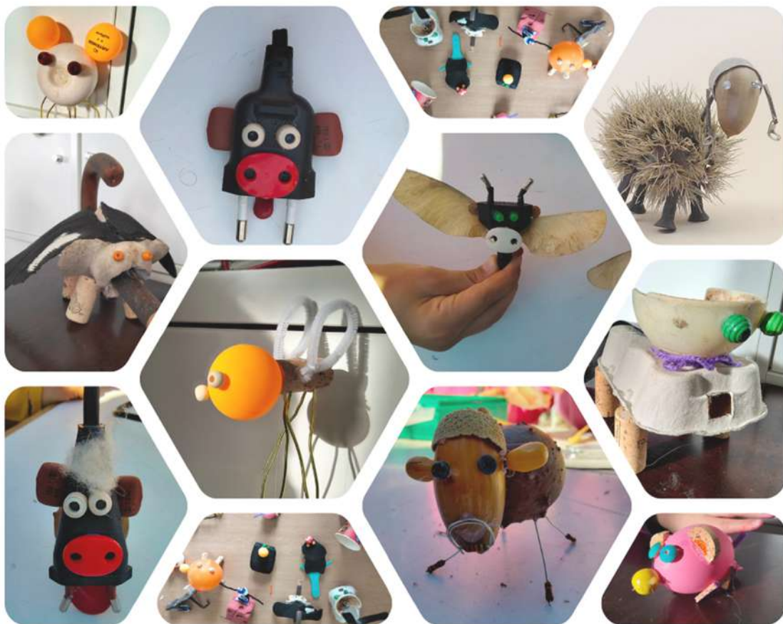
Realizaciones de participantes

Luego cada participante, en forma de juego, crea su propia criatura. Previamente de forma verbal, reciclando palabras. Luego de forma tridimensional y plástica, reciclando objetos, materiales y desechos.